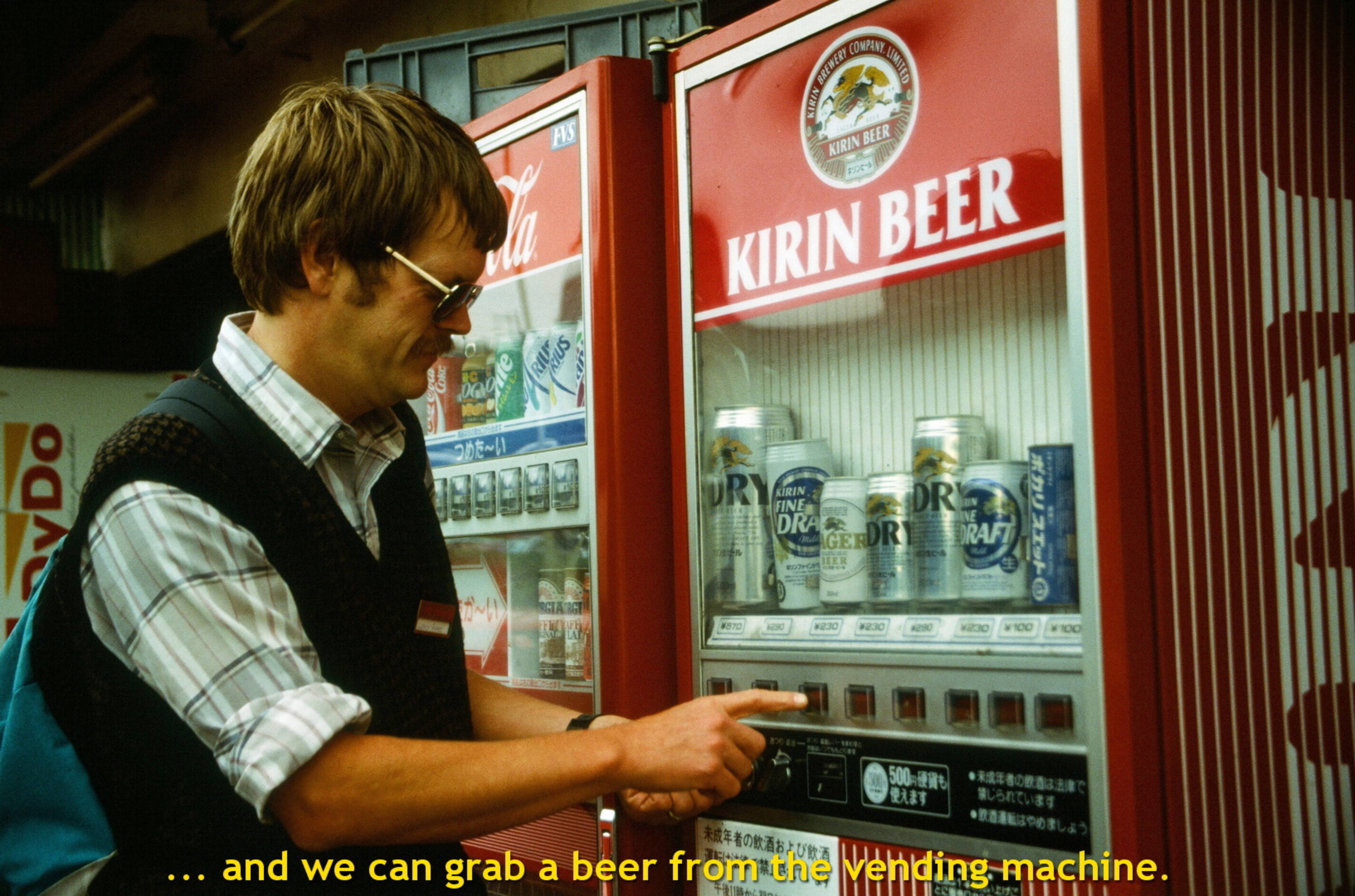
... and we can grab a beer from the vending machine.