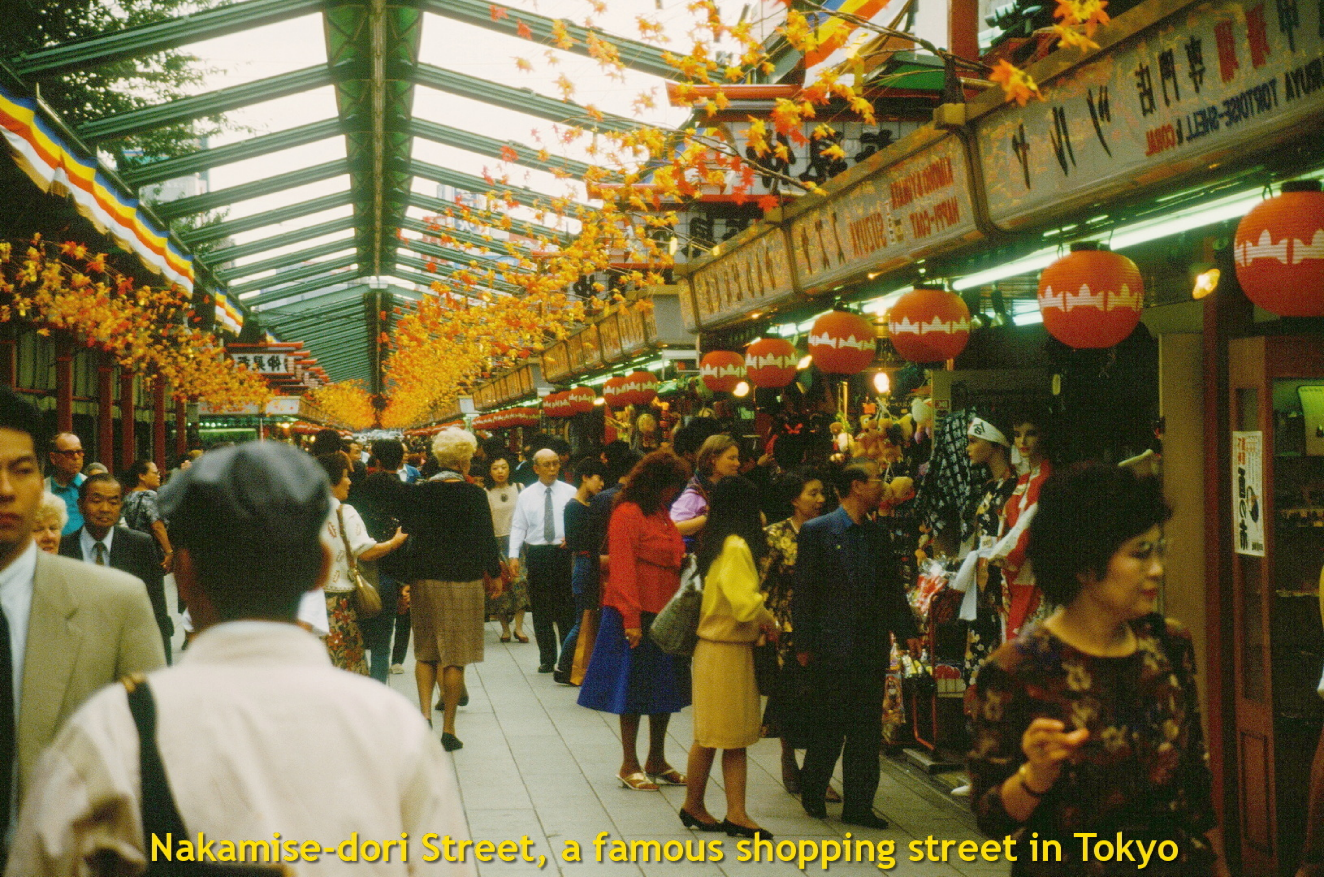
Nakamise-dori Street, a famous shopping street in Tokyo