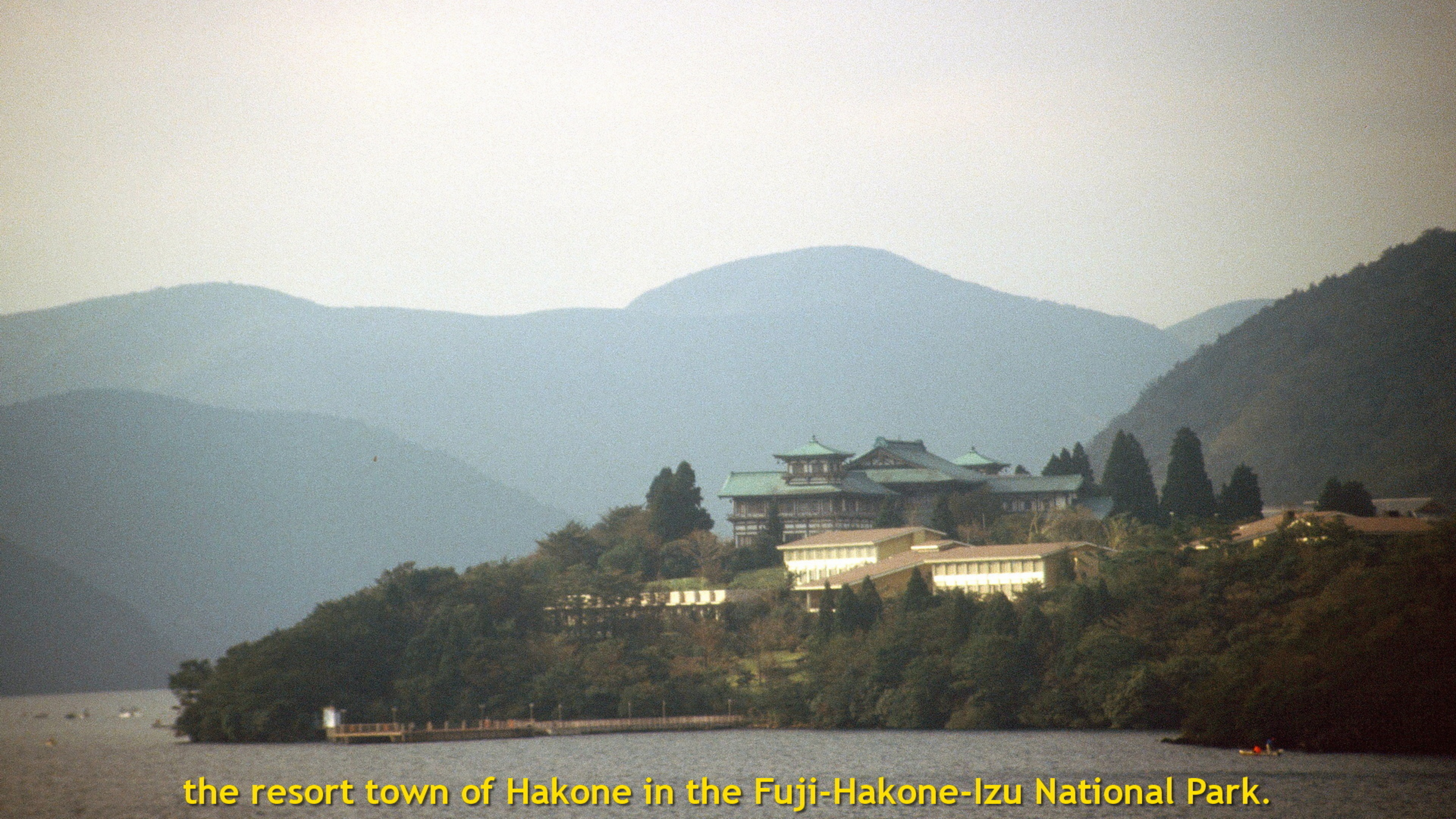
the resort town of Hakone in the Fuji-Hakone-Izu National Park.