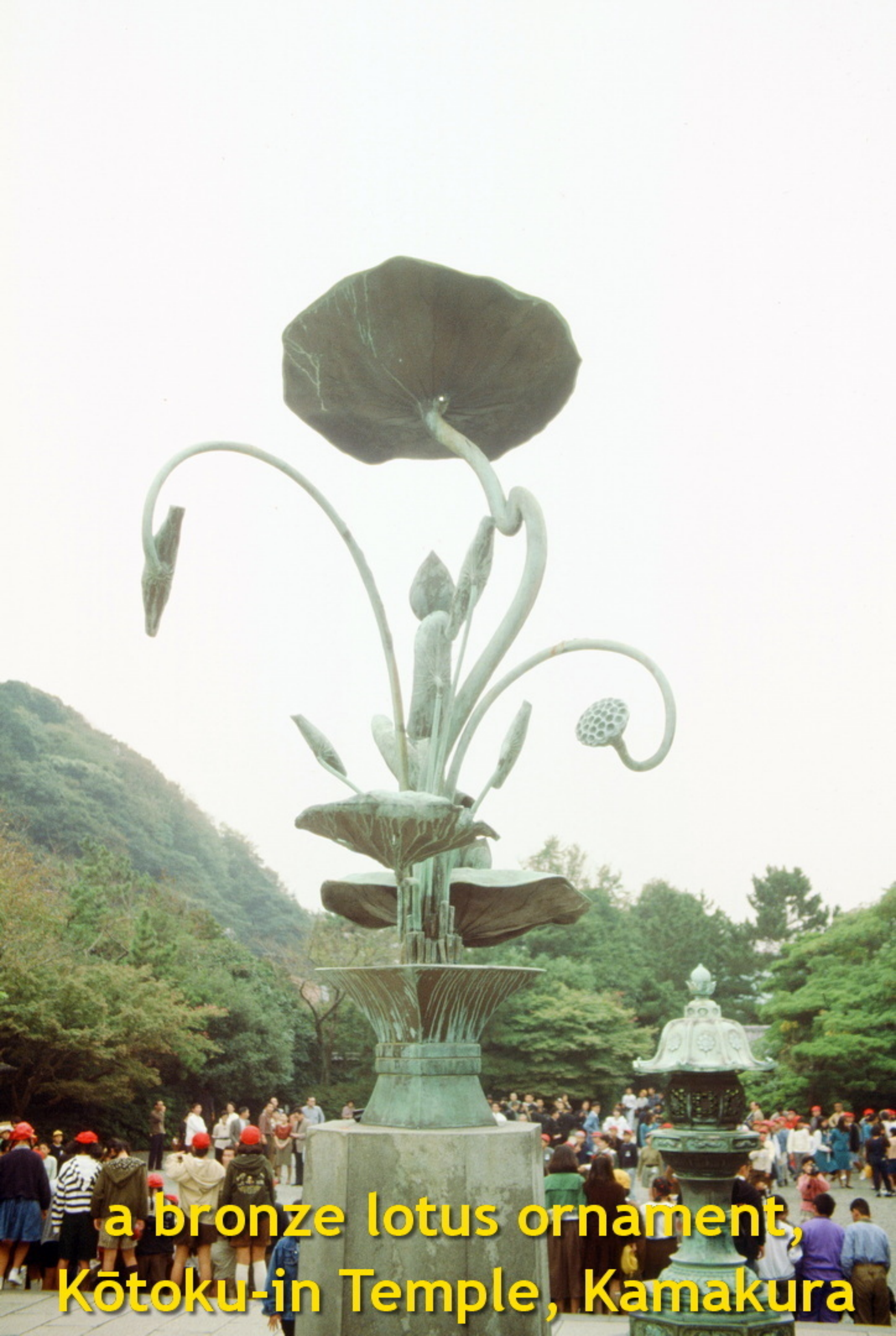
a bronze lotus ornament, Kōtoku-in Temple, Kamakura