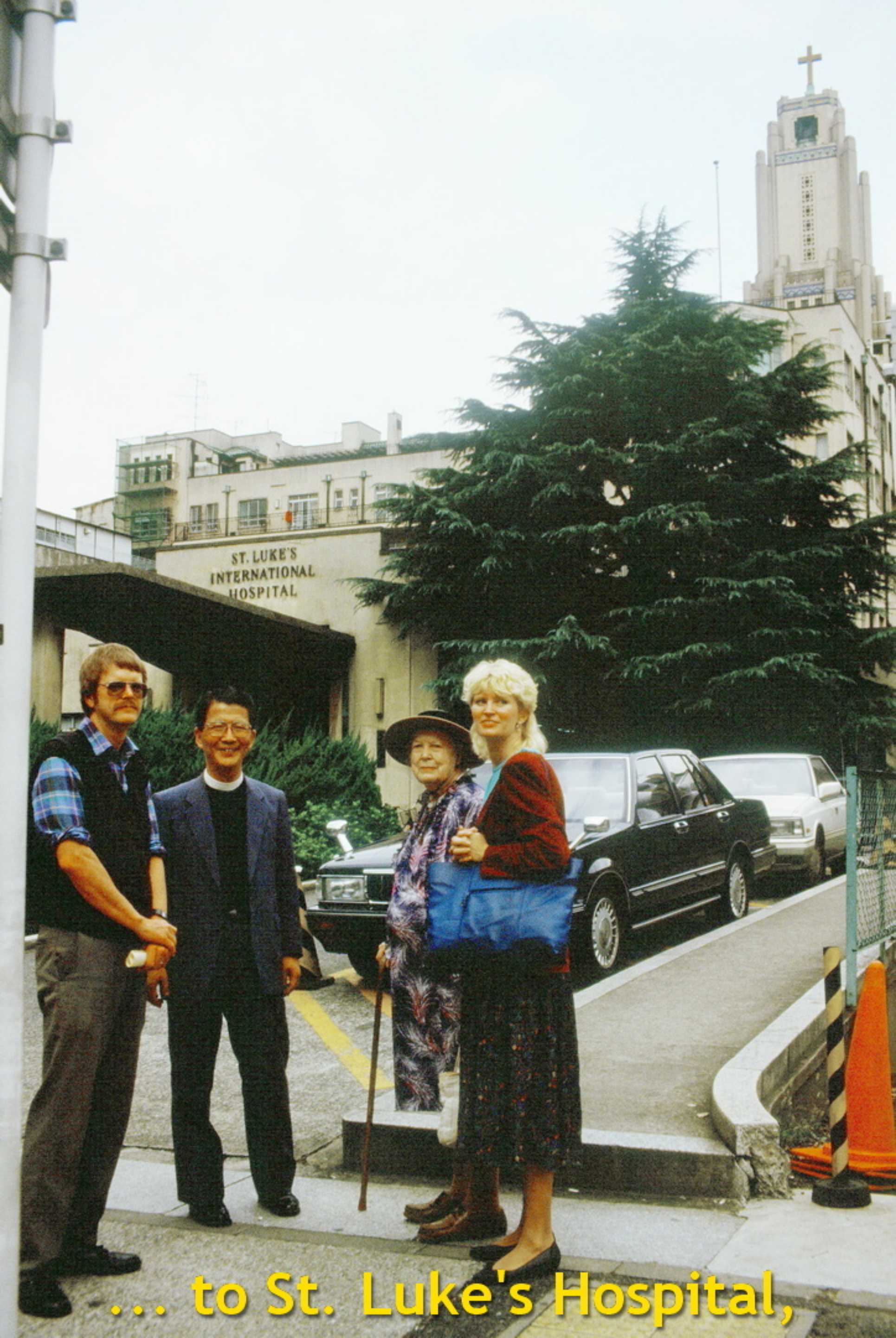
... to St. Luke's Hospital,