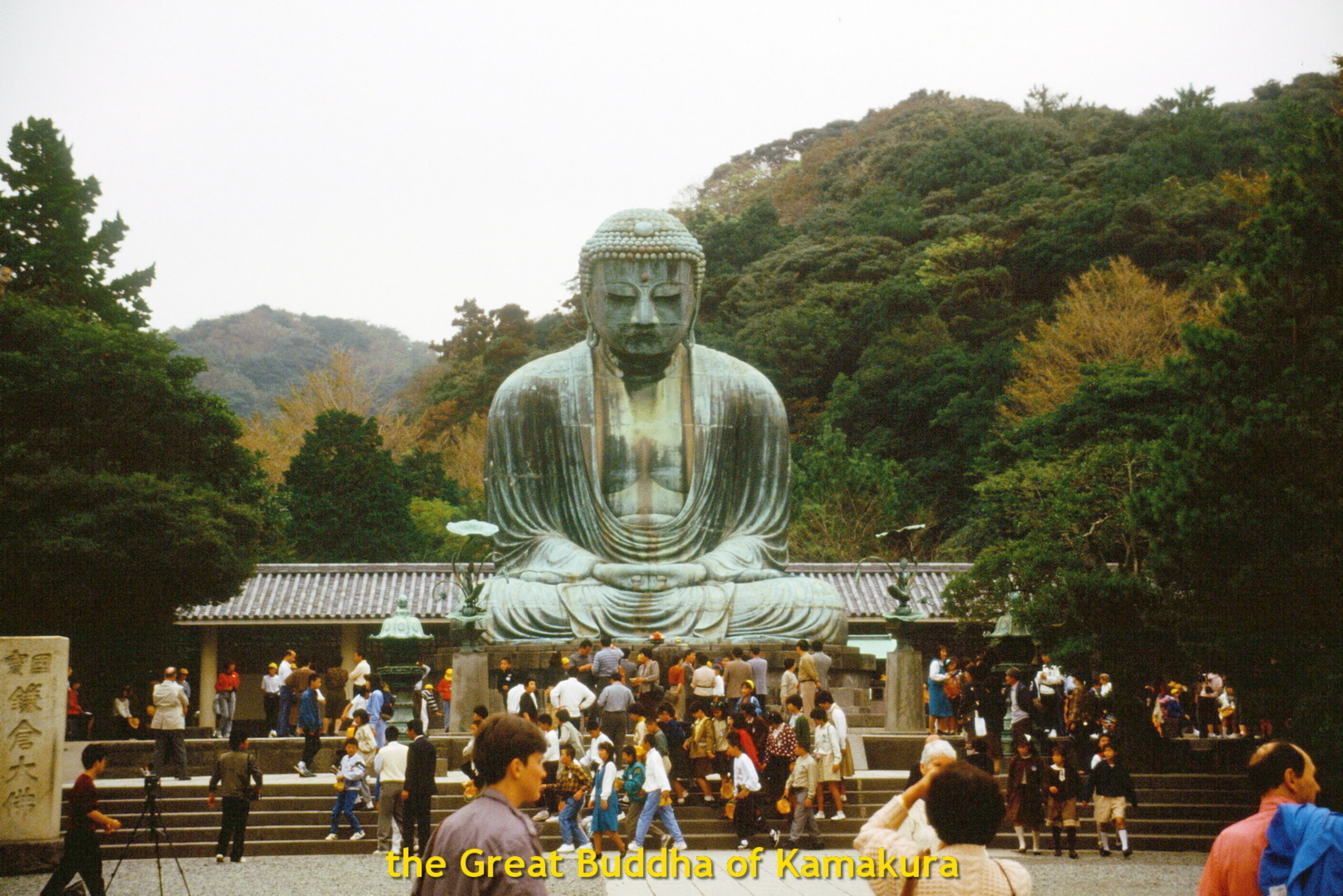
the Great Buddha of Kamakura