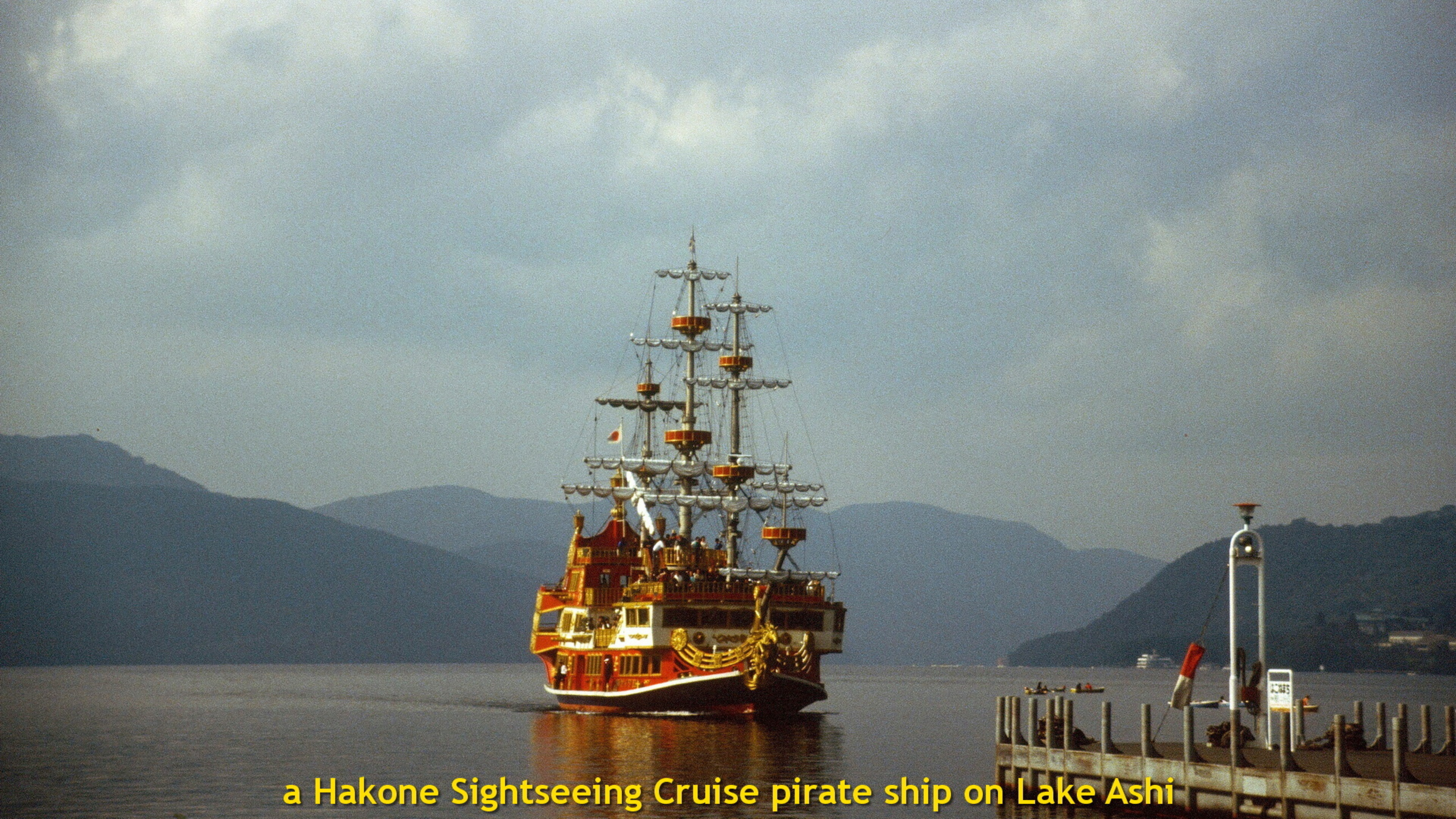
a Hakone Sightseeing Cruise pirate ship on Lake Ashi