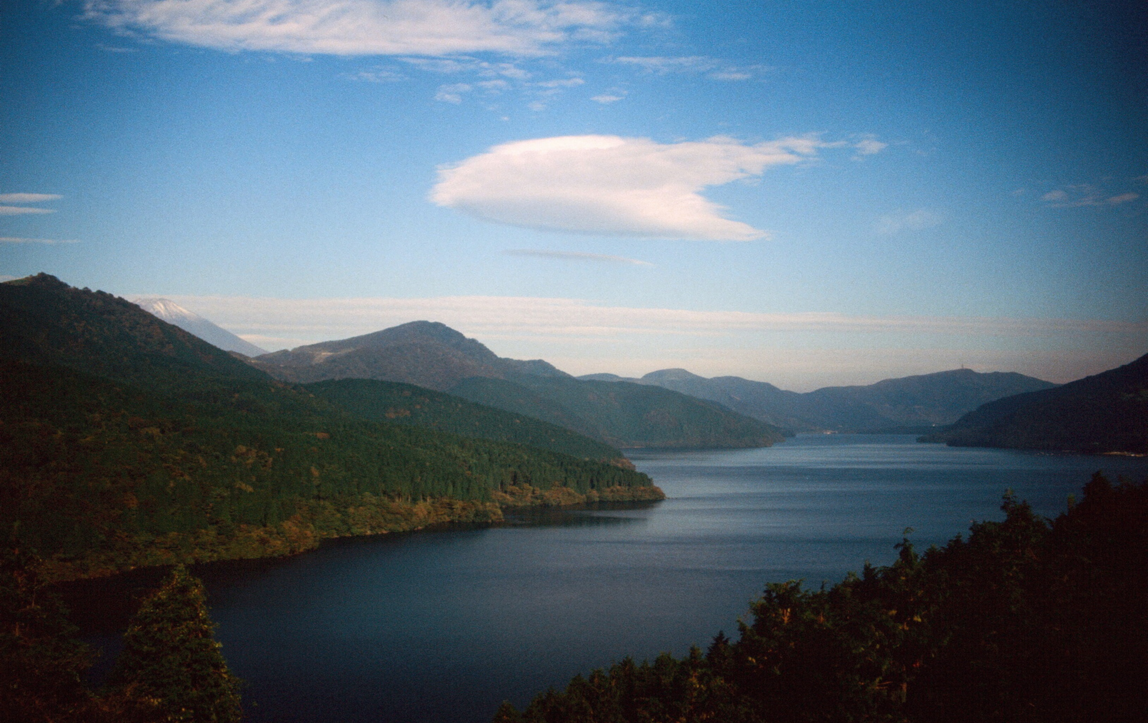
Lake Ashinoko, also known as Hakone Lake or Ashi Lake.