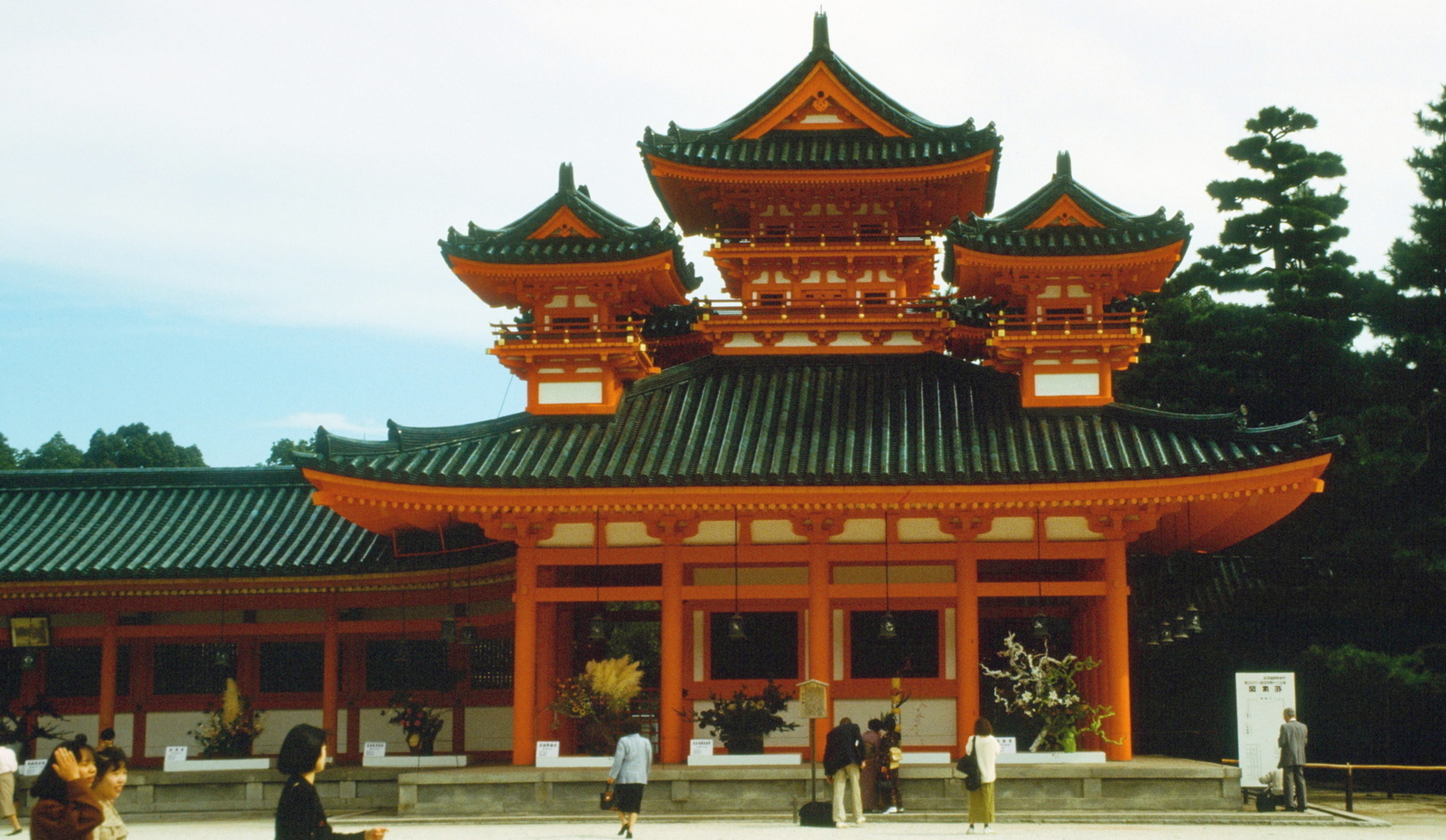
the Heian Shrine (Heian Jingū) in Kyoto