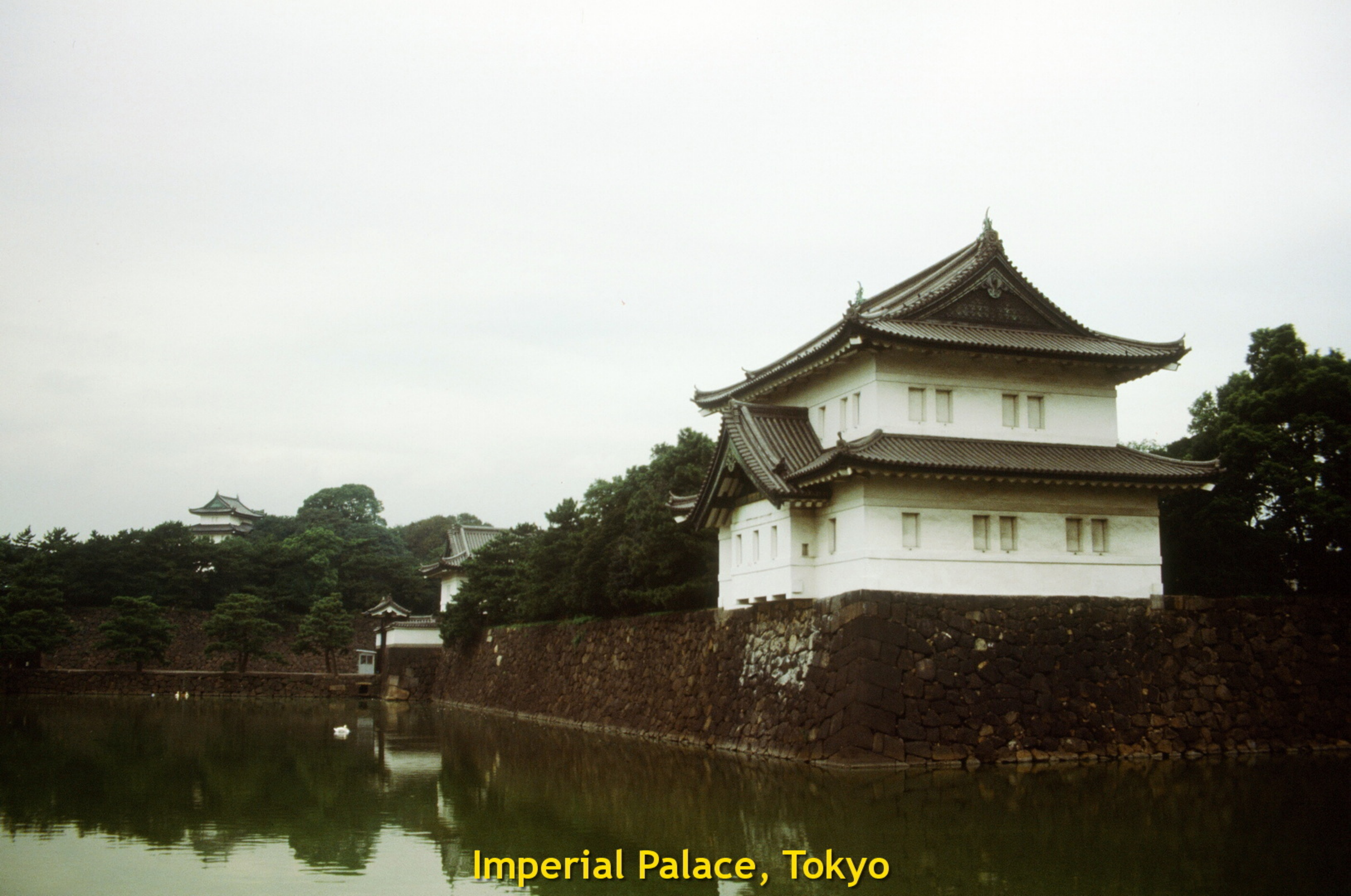
Imperial Palace, Tokyo