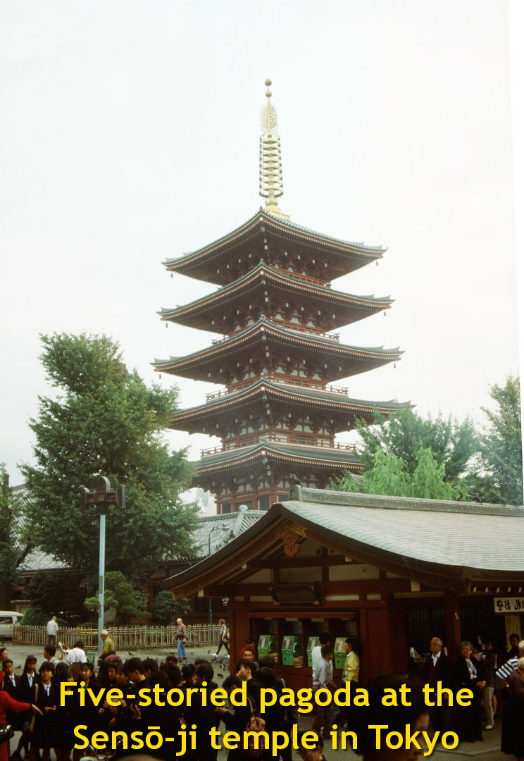
Five-storied pagoda at the Sensō-ji temple in Tokyo