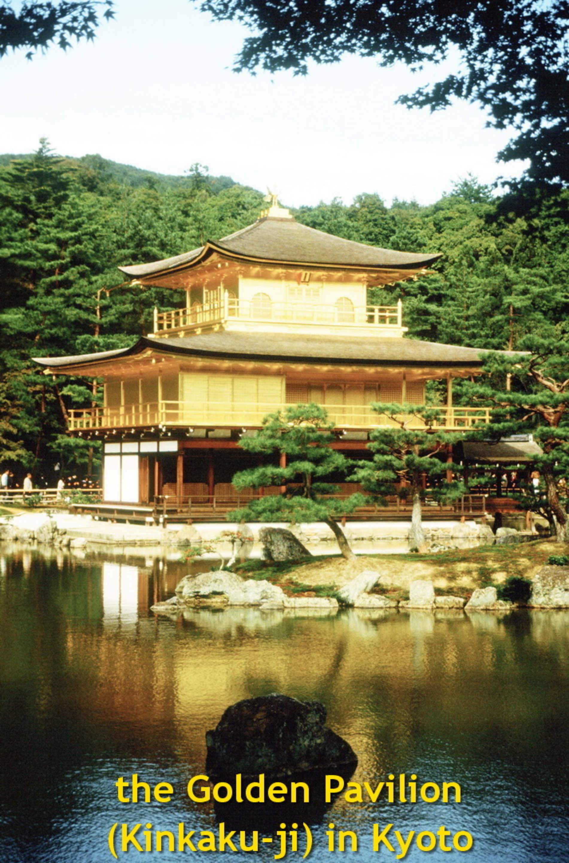
the Golden Pavilion (Kinkaku-ji) in Kyoto